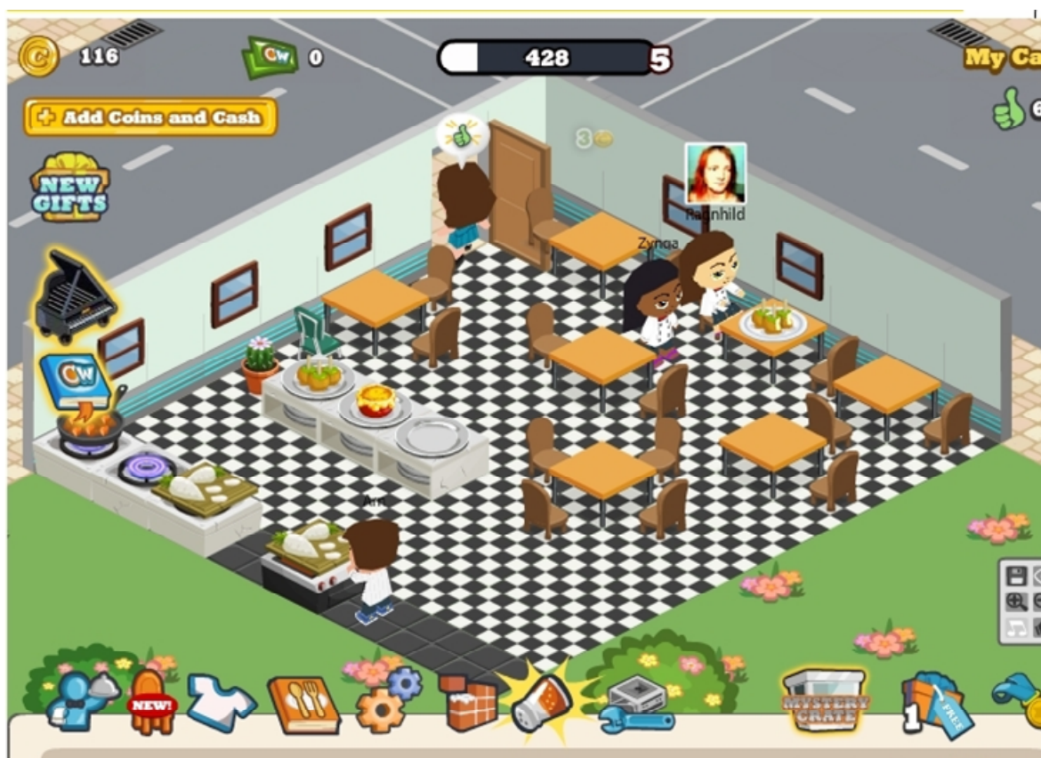
Figur 4 Skjermdump fra "Café World" (7. mai 2010).

Avataren med profilbilde viser ett eksempel på hvordan Café World henter ut profilinformasjon om brukernes Facebook-venner, "Ragnhild", samt hennes profilbilde. "Ragnhild" hadde ikke gitt tilgang til Café World, og fortsatte å dukke opp i spillet selv etter at vedkommende blokkerte applikasjonen, se figur 4.