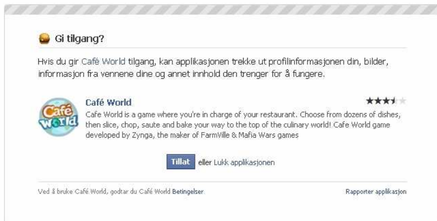
Figur 3 Ved å gi applikasjoner tilgang, kan disse trekke ut profilinformasjon fra brukeren og brukerens venner

Tredjepartsapplikasjoner er applikasjoner utviklet av andre aktører enn Facebook og brukeren selv, noe som er mulig på "åpne" plattformer som Facebook. Eksempler på slike applikasjoner kan være spill, quizer, deling av informasjon fra eksterne nettsider eller annen aktivitet som publiseres og driftes av en tredjepart. Ved bruk av tredjepartsapplikasjoner utleveres informasjon om brukeren, ofte i tillegg til informasjon om brukerens venner, se figur 3 9 .